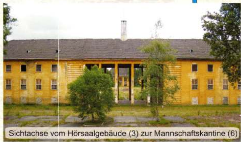
Sichtachse vom Hörsaalgebäude (3) zur Mannschaftskantine (6)